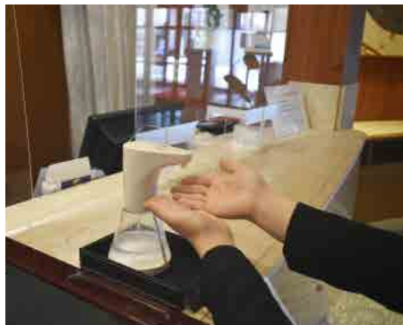
ホテルご来館時の手指消毒