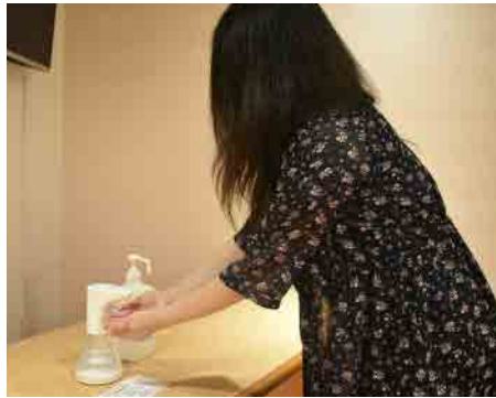
定期的な手指の消毒