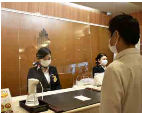
飛沫感染防止用アクリル板の設置