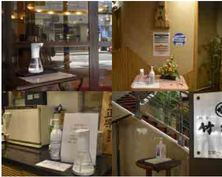
各施設出入口、受付に消毒液の設置