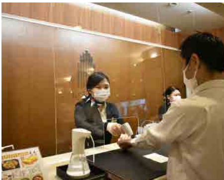
ホテルご来館時の検温