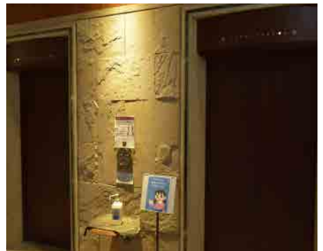
パブリックスペースでの ソーシャルディスタンス

■ホテルご来館時、各施設入店時にはマスク着用と検温のご協力をお願いしております。