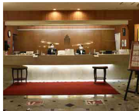
接触・混雑防止の目印設置