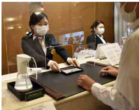
お会計時、キャッシュトレイを使用