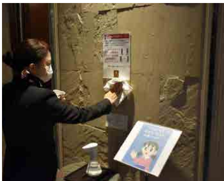
エレベーターボタンの消毒