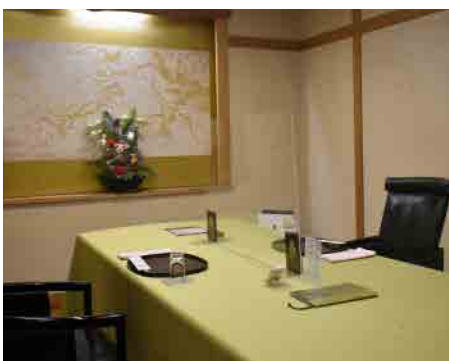
各施設テーブル、イスの配置変更