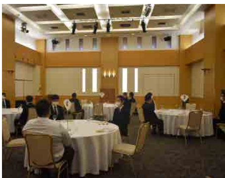
宴会（円卓）着席形式