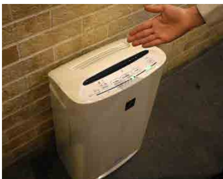
換気しにくい場所には空気清浄機を設置