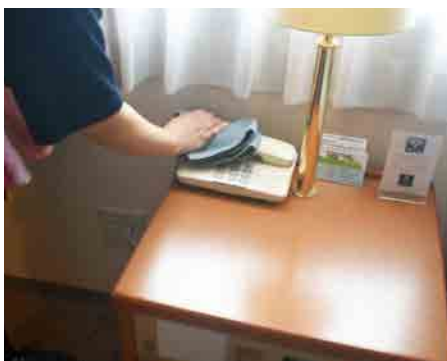
客室清掃時に消毒・換気の徹底