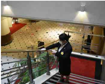
ロビーまわりの定期的な消毒