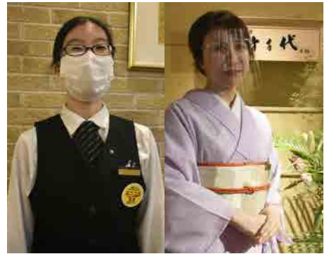
マスク・フェイスガード着用

■全スタッフ出社時に検温をし 37.5 度以上の発熱や体調がすぐれない場合は自宅待機としております。