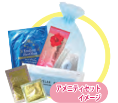
アメニティセット イメージ

レンタカーの必要なお客様は 弊社オリックスレンタカーが 対応いたします。 [詳しくはスタッフまでお問合せ下さい]