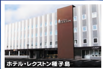
ホテル・レクストン種子島

西川旅行センターのリニューアルオープンを記念して お得なホテルパックをご用意いたしました。 この機会にぜひ一度、ロケットと波乗りの島、 種子島を訪れてみませんか？