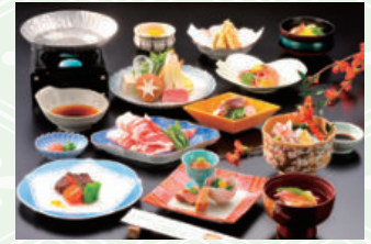
写真は8,000円のイメージです。